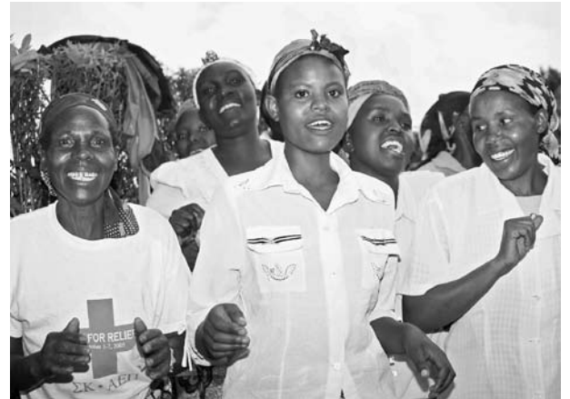
Die Aufnahme stammt vom letzten Projektbesuch und zeigt die typische warmherzige Begrüssung mit Gesang und Tanz.

Nun möchten 89 der insgesamt 200 Frauen zusätzlich ein Geschäft mit (Kunst-)Handwerk aufbauen. Damit können sie einerseits ihre persönliche Situation verbessern, andererseits wollen sie einen Teil der Erträge dazu verwenden, Frauen in Not zu unterstützen – viele der Mitglieder sind aidskrank und können nicht mehr selber für sich sorgen.