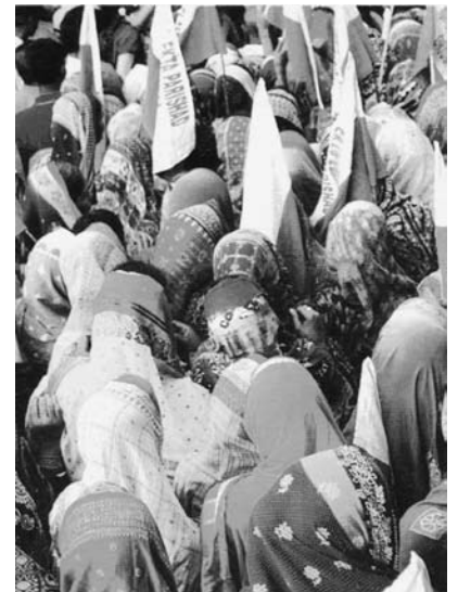
Der nationale Fussmarsch für Landrechte hat einiges in Bewegung gebracht.

Das achtköpfige Team von NSVK hat diese Anregung entgegengenommen und wird sich neben der regionalen Kampagnenarbeit stärker um die Umsetzung der Landrechtsanliegen und weiterer Themen auf Dorfebene bemühen. Ein wichtiger Teil des Budgets ist deshalb für die Weiterbildung der Frauengruppen zu verschiedenen Gesetzen und Förderprogrammen reserviert. Der Erfolg von NSVK wird bei der nächsten Evaluation auch daran gemessen, wie viele Anträge die Frauen selbständig gestellt haben.