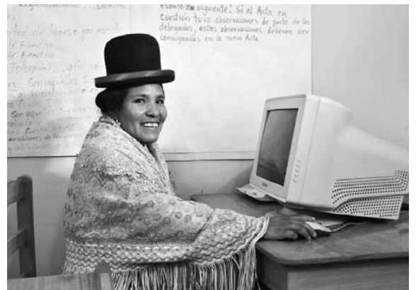
Ohne das Angebot der Gewerkschaft wäre es kaum einer Haushaltangestellten möglich, zu lernen, wie man einen Computer bedient.

Um das Angebot bei jungen Frauen, die neu in die Stadt kommen, bekannt zu machen, ist die Gewerkschaft auf Radiowerbung angewiesen. Insbesondere die vielen Analphabetinnen können so am besten erreicht werden. Ausserdem wird die Gewerkschaft ein neues Lokal beziehen müssen und braucht einen Beitrag an das neue Mietzinsdepot.