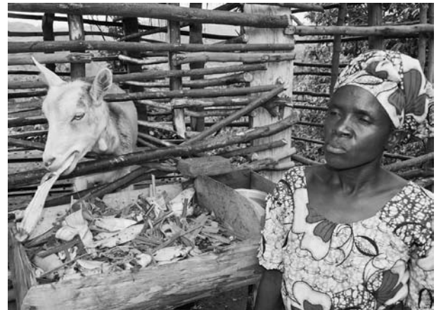
Dank einiger Ziegen können auch behinderte Frauen ihren Lebensunterhalt bestreiten.

Die Vorstandsmitglieder von KADIWOD nehmen im Rahmen dieses Projekts regelmässig an Weiterbildungstreffen teil und werden dabei unter anderem in Politik und Rechtsfragen geschult.