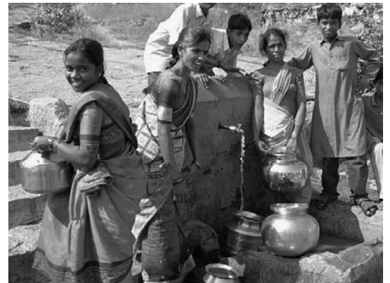
Ein grosses Problem ist die mangelnde Trinkwasserversorgung. In der kommenden Projektphase soll deshalb die Regierung in die Pflicht genommen werden.