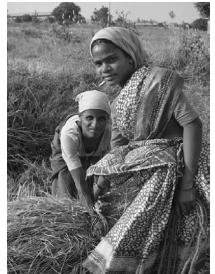
Viele Kinder gehen nicht zur Schule, da sie den Eltern helfen müssen.

Auch das Problem der Nahrungsunsicherheit muss dringend angegangen werden. Die Frauengruppen sollen befähigt werden, bei den zuständigen Regierungsstellen Anträge für die Einrichtung von Pumpsystemen für den Gemüseanbau, für den Bau von Fischteichen, Speichereinrichtungen und anderer Infrastruktur zu stellen.