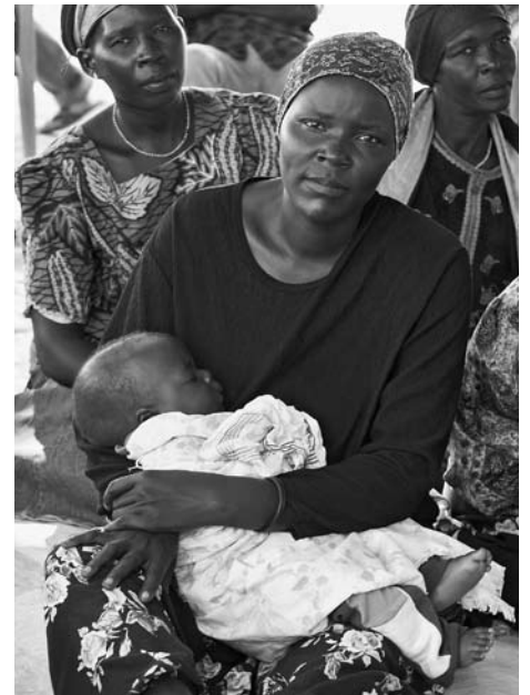
Der jahrelange Aufenthalt in Camps war alles andere als einfach. Doch nun beginnen sich die Lebensumstände zu normalisieren.

Nach dem Training bekommen sie pro Gruppe ca. 50 kg Samen (Mais, Sorghum, Gemüse, Bohnen, Erdnüsse). Innerhalb der Gruppen werden sie daraus einen Rotationsfonds aufbauen. Jede Frau gibt die Menge Samen zurück, die sie erhalten hat, sowie die Hälfte der Menge als Zins. Nach der Ernte entscheiden die Gruppen im Kollektiv, wie viele Samen wieder ausgesät werden und wie viel Saatgut verkauft werden kann. Mit dem erwirtschafteten Gewinn sollen langfristig auch weitere Ausbildungen und neu entstehende Gruppen unterstützt werden.