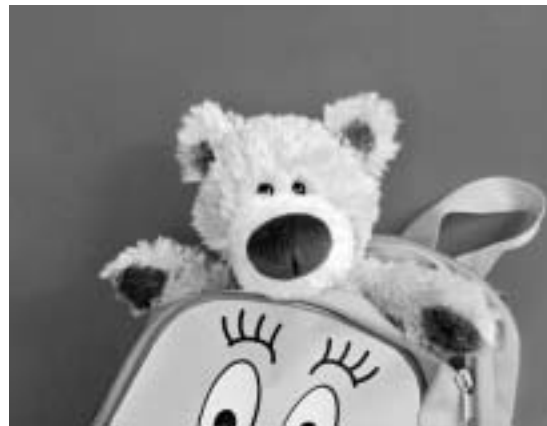
SOFO – Rucksäcke des Lebens.