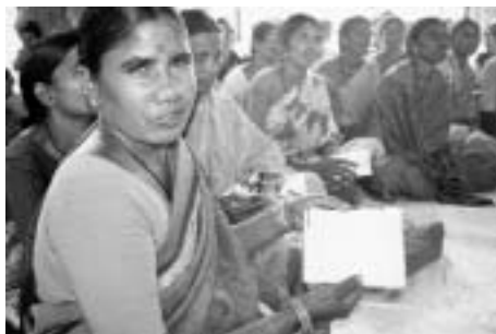
In vielen EW-Projekten werden Frauen auch in einfacher Buchhaltung geschult.